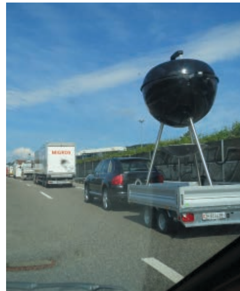
Der Haus-Altar der Grillgemeinde kann auch anders: Im Grossformat unterwegs zum nächsten Messegelände.

Als ich selber noch Milchschafe hielt, habe ich die überzählige Nachkommenschaft jeweils während des Fressens an der Krippe mit einem Bolzenschuss getötet. Ich wusste, dass das kräftige Lamm nie mehr aufstehen würde, und fand es lächerlich, von Betäuben zu sprechen. Die links und rechts Fressenden wackelten beim Knall kurz mit den Ohren und drängten in die frei werdende Lücke, während ich hinten im Stroh den Hals des Tieres aufschnitt. Danach zuckt es noch eine Weile mit den Beinen. Ausser mir schien nie jemand bemerkt zu haben, dass ein Leben zu Ende gegangen war. Mir bereitete die Sache trotzdem keine Freude, schon einen Tag im Voraus war ich misslaunig. Einen Tag danach empfand ich eine gewisse