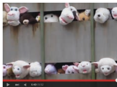
Sirens of the lambs