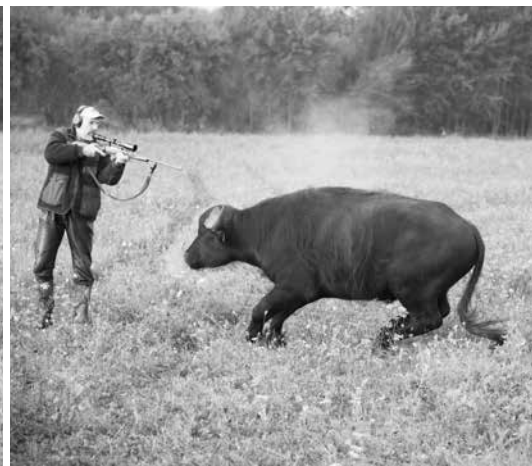
Der Betäubungsschuss bei der Weideschlachtung geschieht aus nächster Nähe, entweder aus dem Stand oder von einem Hochsitz.